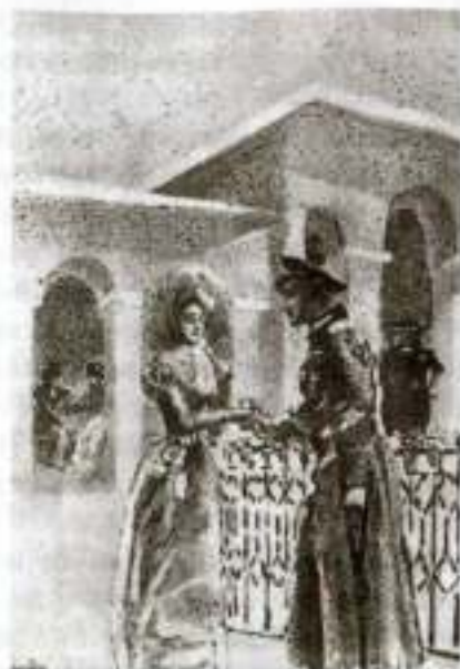
«Герой нашего времени». Грушницкий и княжна Мери. Художник М. Врубель

ри, Печорин находится на распутье и вовсе не торжествует победу.