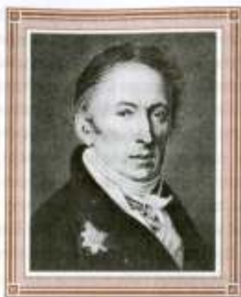
Николай Михайлович КАРАЗИН (1766—1826)

По многосторонности дарований — поэт, прозаик, историк, реформатор русского литературного языка, журналист, общественный деятель — Н. М. Карамзин сродни Ломоносову и просветителям, подобным Вольтеру, Дидро, Руссо. Его влияние на русскую общественную мысль, русскую литературу и отечественную историю необыкновенно велико.