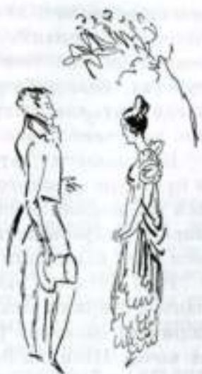
«Евгений Онегин». Татьяна и Онегин. Художник И. Кузьмин

пламенным и нежным». В противоположность Онегину, духовное развитие которого совершается от преобладания рассудка к гармонии ума и чувства, самовоспитание Татьяны совершается иначе: от наивности, непосредственности чувств к их обогащению просвещенным умом.