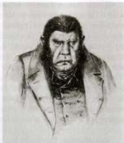
«Мертвые души». Собакенич. Художник П. Боклевский

Манилова, у которого нет никакого задора и который не ведает ни добра, ни зла.