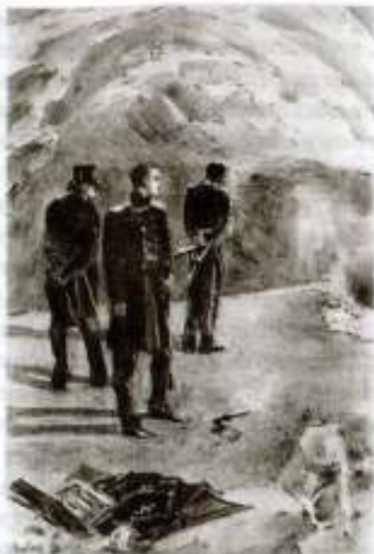
«Герой нашего времени».