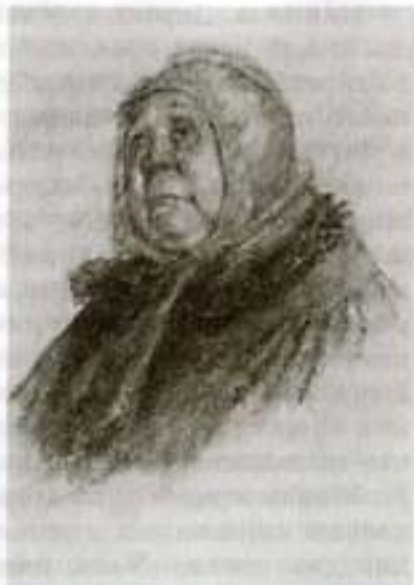
«Мертвые души». Коробочка. Художник П. Воклевский

ворят: «Люди так себе, ни то ни се; ни в городе Богдан ни в селе Селифан...» Все, что остается от общения с ним, — смертельная скука. «От него, — пишет Гоголь, — не дождешься никакого живого или хоть заносчивого слова, какое можешь услышать почти от всякого, если коснешься задирающего его предмета. У всякого есть свой задор <...>, у всякого есть свое, но у Манилова ничего не было». Манилов способен только мечтать, но мечты его мертвые, они никогда не осуществляются и, главное, никуда не ведут. Хорошо было бы, пустопорожно фантазировал Манилов, «от дома провести подземный ход или через пруд выстроить каменный мост...», а потом после отъезда Чичикова посетили его голову другие мысли: «Он думал о благополучии дружеской жизни, о том, как бы хорошо было жить с другом на берегу какой-нибудь реки, потом через эту реку начал строиться у него мост, потом огромнейший дом с таким высоким бельведером 1 , что можно оттуда видеть даже Москву...»