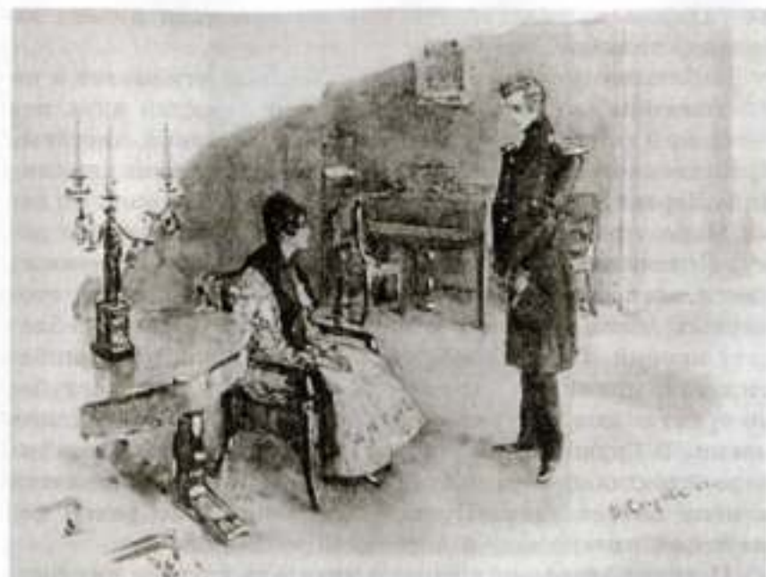
«Герой нашего времени», Печорин и княжна Мери. Художник В. Серов

Опыт Печорина удался: он добился любви Мери, развенчав Грушницкого, даже защитил ее честь от клеветы. Однако результат «смешного» развлечения («я над вами смеялся») драматичен, вовсе не весел, но и не лишен положительного значения. Нравственно и душевно Мери выросла, и власть светских законов отныне станет для нее относительной, а не абсолютной. Мери придется учиться понимать и любить человечество, потому что она обманулась не в одном лишь Грушницком, но и в непохожем на него Печорине. Здесь уже недалеко до мизантропии, до человеконенавистничества и скептического отношения к любви, к прекрасному и возвышенному. Ненависть, замещающая чувство любви, может касаться не только конкретного случая, а стать принципом, нормой поведения и обрести абсолютный характер.