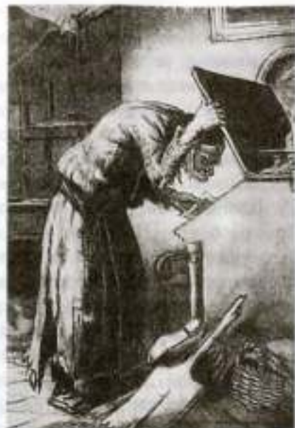
«Мертвые души». Плюшкин. Художник П. Боклевский

рима с виной Манилова, Коробочки и Ноздрева. Гоголю не потребовалось обличать Собакевича авторским словом: картины, нарисованные им, достаточно красноречивы, тем более что Собакевич, как и Ноздрев, — характер яркий, броский, сам себя высмеивающий и разоблачающий.