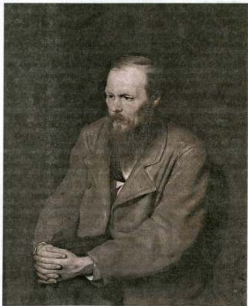
В. Г. Перов. Ф. М. Достоевский

В 1872 году В. Г. Перов написал известный портрет Ф. М. Достоевского. Жена писателя, А. Г. Достоевская, была довольна портретом: художнику удалось уловить «минуту творчества».