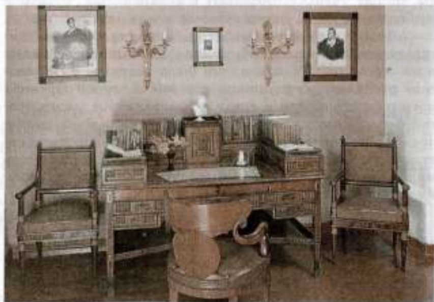
Комната М. Ю. Лермонтова в Тарханах Пензенской губернии.

Мечты юного Лермонтова о гражданском деянии, о «славе» («За дело общее, быть может, я паду...».