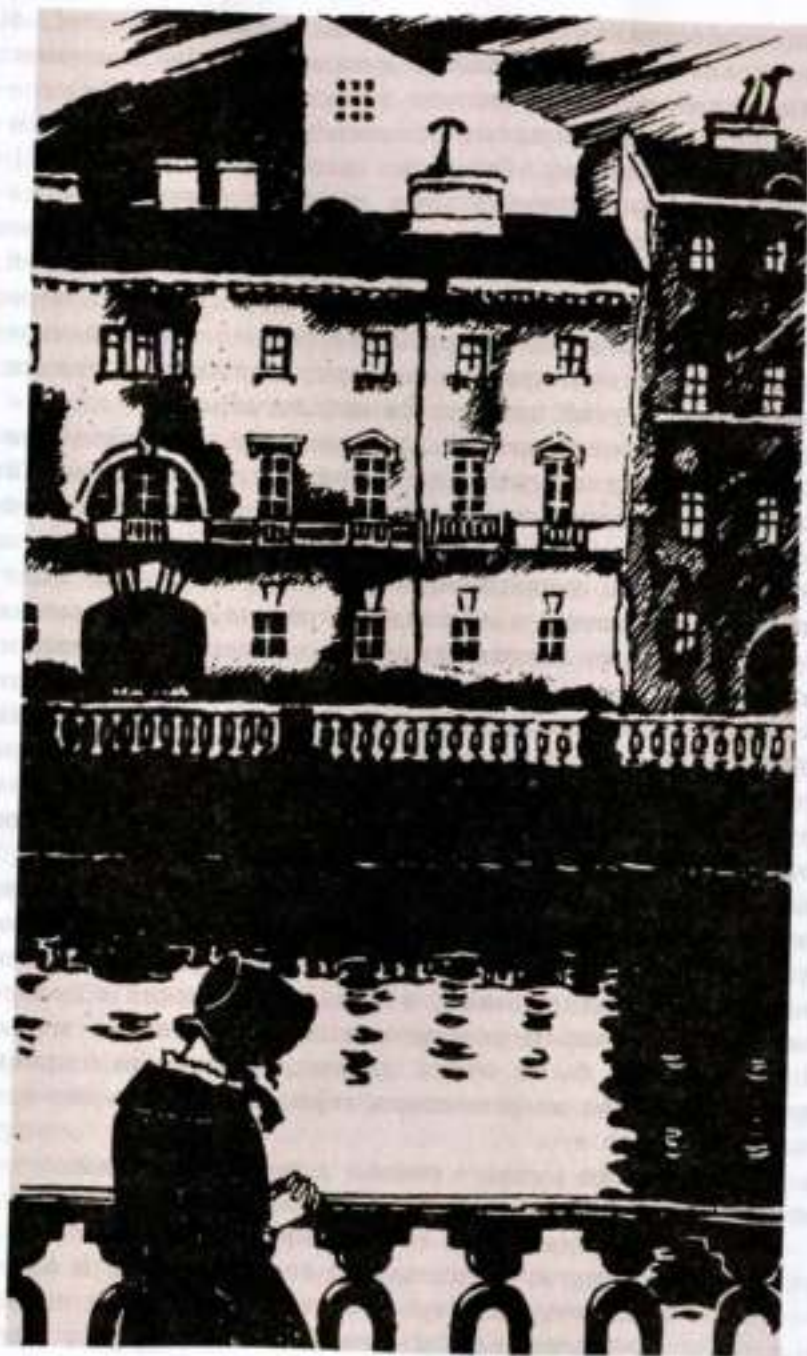
«Белые ночи». Художник М. Добужинский