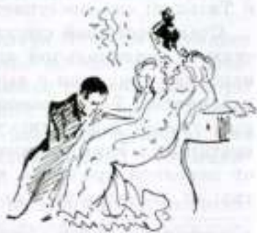
«Евгений Онегин». Татьяна и Онегин. Художник Н. Кузьмин