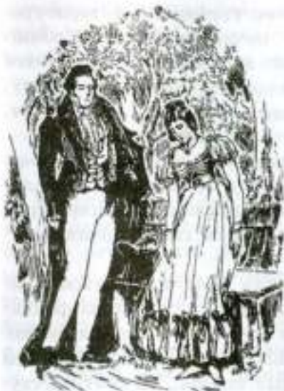
«Евгений Онегин». Татьяна и Онегин. Художник Д. Бардовский