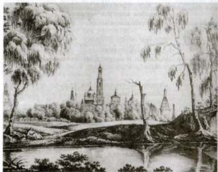
Лизин пруд. Художник Н. Соколов

Лизина мать услышала о страшной смерти дочери своей, и кровь ее от ужаса охладела — глаза навек закрылись.— Хижина опустела. В ней воет ветер, и суеверные поселяне, слыша по ночам сей шум, говорят: «Там стонет мертвец; там стонет бедная Лиза!»