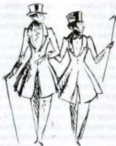
«Евгений Онегин». Художник Н. Кузьмин