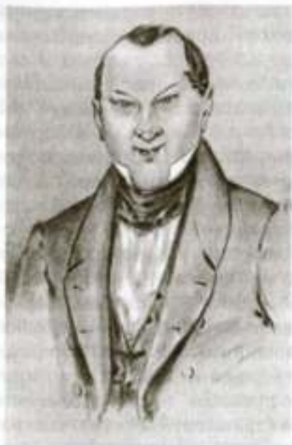
«Мертвые души». Чичиков. Художник П. Боклевский

и появился в России. Чиновники «нашли, что лицо Чичикова, если он поворотится и станет боком, очень сдает на портрет Наполеона». Кроме того, ростом Наполеон никак не выше Чичикова, а фигурой «тоже нельзя сказать, чтобы слишком толст, однако же и не так, чтобы тонок». Но этого мало. И вот уже появляется предсказание некоего пророка, который «возвестил, что Наполеон есть антихрист...», что он может овладеть «всем миром». Не только чиновники губернского города, но и чиновники столиц и лица из благородного дворянства, зараженные мистицизмом, «видели в каждой букве, из которых было составлено слово Наполеон, какое-то особенное значение, многие даже открыли в нем апокалипсические цифры». Наконец, когда и эта версия никуда не привела, чиновники решили спросить Ноздрева. Хотя и знали, что он лгун, все-таки «прибегнули к нему». Ноздрев тоже мало чем помог: «И остались чиновники в еще худшем положении, чем были прежде, и решилось дело тем, что никак не могли узнать, что такое был Чичиков».