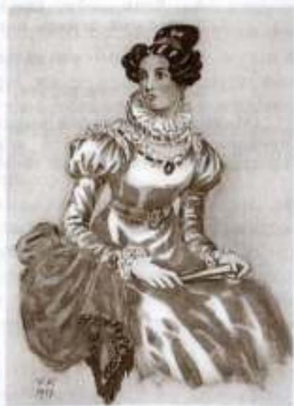
«Горе от ума». Софья. Художник Н. Кузьмин