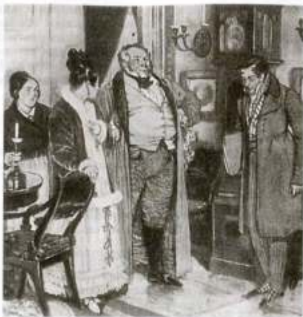
«Горе от ума». Действие I. Художник Д. Кардовский