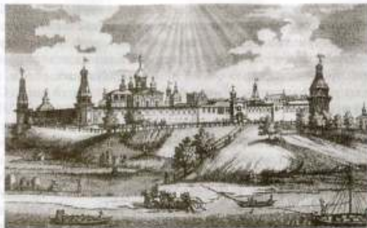
«Белая Лица». Московский Симонов монастырь. Старинная гравюра

которая представляется глазам в образе величественного амфитеатра : великолепная картина, особенно когда светит на нее солнце, когда вечерние лучи его пылают на бесчисленных золотых куполах, на бесчисленных крестах, к небу возносящихся! Внизу расстилаются тучные, густо-зеленые, цветущие луга, а за ними, по желтым пескам, течет светлая река, волнуемая легкими веслами рыбацких лодок или шумящая под рулем грузных стругов, которые плывут от плодоноснейших стран Российской империи и наделяют алчную Москву хлебом. На другой стороне реки видна дубовая роща, подле которой пасутся многочисленные стада; там молодые пастухи, сидя под тению деревьев, поют простые, унылые песни и сокращают тем летние дни, столь для них единообразные. Подалее, в густой зелени древних вязов, блистает златоглавый Данилов монастырь; еще далее, почти на краю горизонта, синеются Воробьевы горы. На левой же стороне видны обширные, хлебом покрытые поля, лесочки, три или четыре деревеньки и вдали село Коломенское с высоким дворцом своим.