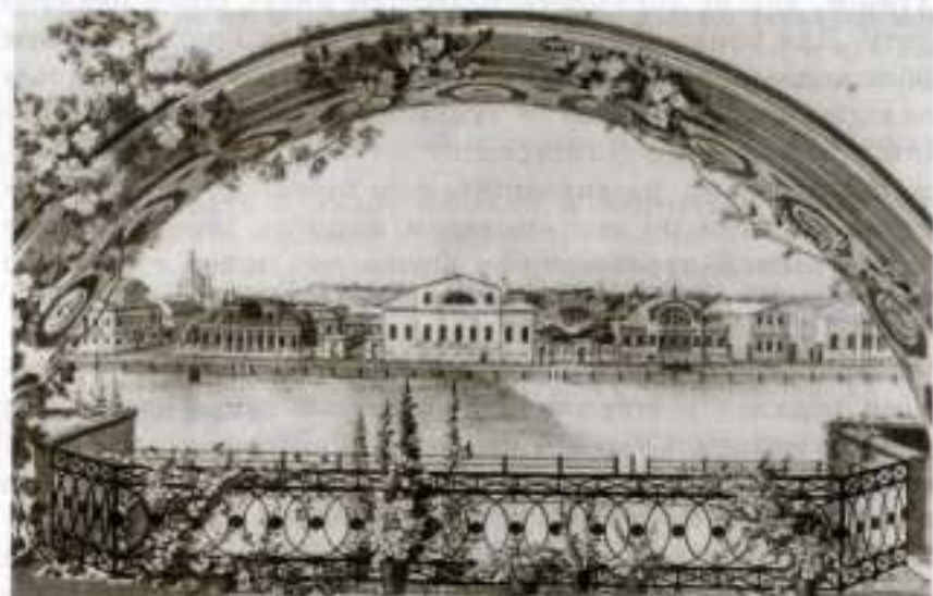
Дом Грибоедовых на Новинском бульваре в Москве (крайний слева). Литография начала XIX в.

Круг знакомых. Дар сочинительства проявился в нем рано. В университете он написал комедию «Дмитрий Дрянской» (не сохранилась), выставившую в смешном свете борьбу русских и немецких профессоров. Блестяще образованный, искрометный остроумец, Грибоедов привлекал к себе тогдашнюю вольнолюбивую офицерскую и штатскую молодежь. Со многими будущими декабристами (И. Д. Якушкин, Н. И. Тургенев, С. П. Трубецкой, В. Ф. Раевский) он познакомился в смоленском имении дяди по матери. Впоследствии, после выхода из университета, сблизился с П. Я. Чаадаевым, П. И. Пестелем, П. А. Катениным, П. А. Вяземским, А. А. Шаховским, А. А. Бестужевым, В. К. Кюхельбекером, А. С. Пушки-