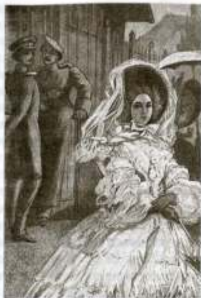
«Герой нашего времени». Мери на прогулке. Художник В. Верещагин

учить...»), и драгунский капитан, ее кавалер, берется это исполнить. Печорин разрушает его замысел и спасает Мери от клеветы драгунского капитана и его шайки. Мелкий эпизод на танцах (приглашение со стороны пьяного господина во фраке) также выдает хрупкость будто бы устойчивого состояния княжны Мери в свете и вообще в мире. Несмотря на богатство, на социальное положение, на связи, Мери постоянно подстерегают опасности. Ее юная, светлая душа воспитана «светом», Мери восприняла его привычки и поведение. Природное начало в Мери погружено в несвойственную ему среду условности, господствующих приличий, прикрывающих, маскирующих подлинные мотивы поведения и подлинные страсти.