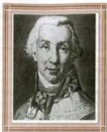
Гавриил Романович ДЕРЖАВИН (1743—1816)

Гавриил Романович Державин родился в Казанской губернии в небогатой дворянской семье. В начале своей жизни он узнал и горе, и нужду. Первоначальное скудное образование получил дома, затем обучался в казанской гимназии, которую, однако, не закончил. В 1762 году он прибыл в Преображенский полк в Петербург и долго служил солдатом. Лишь через десять лет его произвели в прапорщики. К тому времени он на своем опыте изучил военные и гражданские порядки, что позволило ему сохранить трезвость ума и здравый смысл.