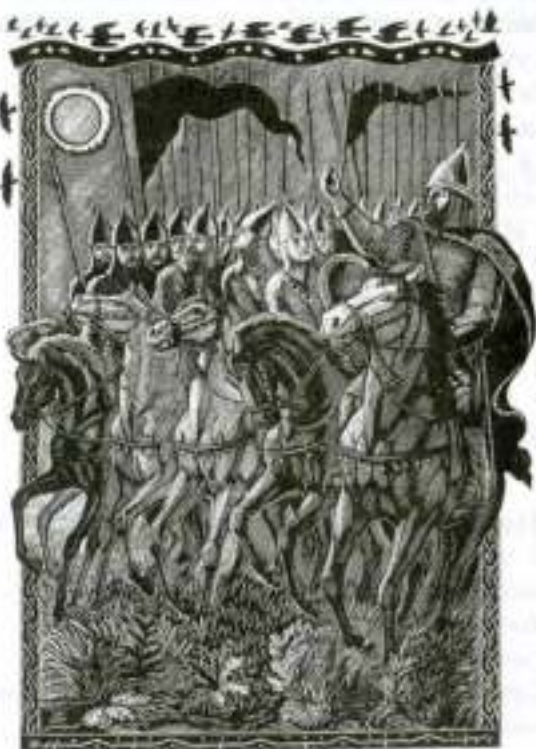
«Слово о подвигу Игореве». Затмение солнца. Художник В. Фаворский.

— А куряне славные — Витязи исправные: Родились под трубами, Росли под шеломами, Выросли, как воины,