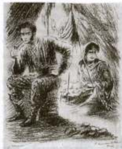
«Цыганы». Алеко и Земфира. Художник К. Клементьева