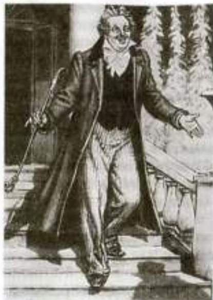
«Мертвые души». Манилов. Художник П. Воклевский