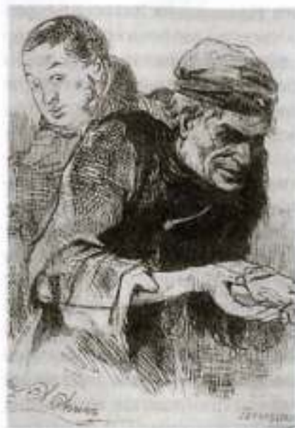
«Мертвые души». Плюшкин. Художник А. Айвазовский