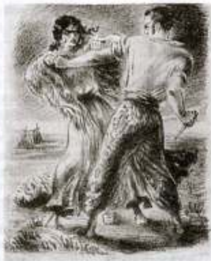
«Цыганы». Алеко и Земфира. Художник К. Клементьева

Людмилы» и кончая «Медным всадником». Он создал русский вариант романтической поэмы («Кавказский пленник», «Братья разбойники», «Бахчисарайский фонтан»). Завершением жанра романтической поэмы стали «Цыганы».