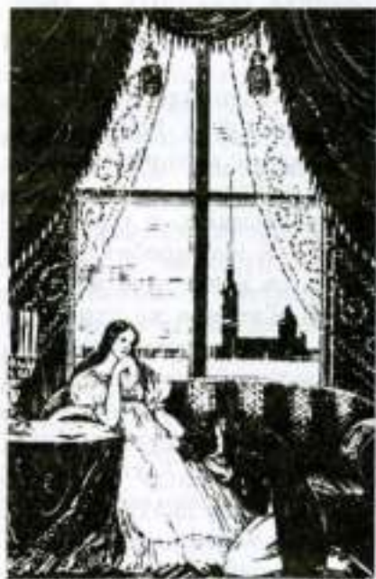
«Евгений Онегин». Татьяна и Онегин. Художник М. Добужинский

Автор в романе. Творя особый, вымышленный мир романа, сам Пушкин выступает как реальное действующее лицо, остающееся, однако, за рамками сюжета. Он вводит в произведение своих друзей и знакомых, достигая правдоподобия и исторической достоверности в описании развивающихся событий. Так, например, Онегин