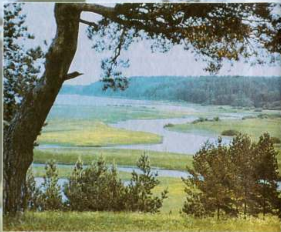
Михайловское. Вид с Савкиной горки на реку Сороть

Как счастлив я, когда могу покинуть Докучный шум столицы и двора И убежать в пустынные дубравы, На берега сих молчаливых вод.