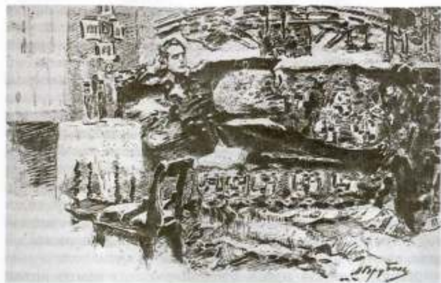
«Герой нашего времени». Художник М. Врубель

Сюжет — та же совокупность событий, происшествий, а также мотивов и стимулов поведения в их композиционной последовательности.