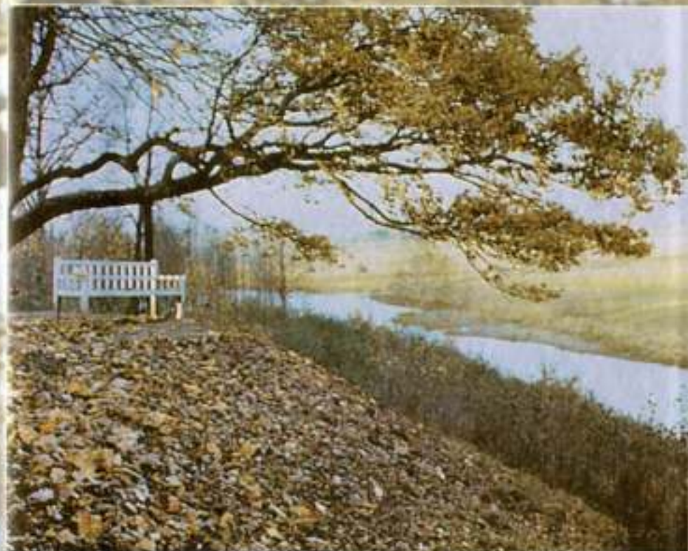
«Скамья Онегина» в Тригорском парке