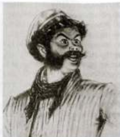
«Мертвые души». Ноздрев. Художник П. Боклевский