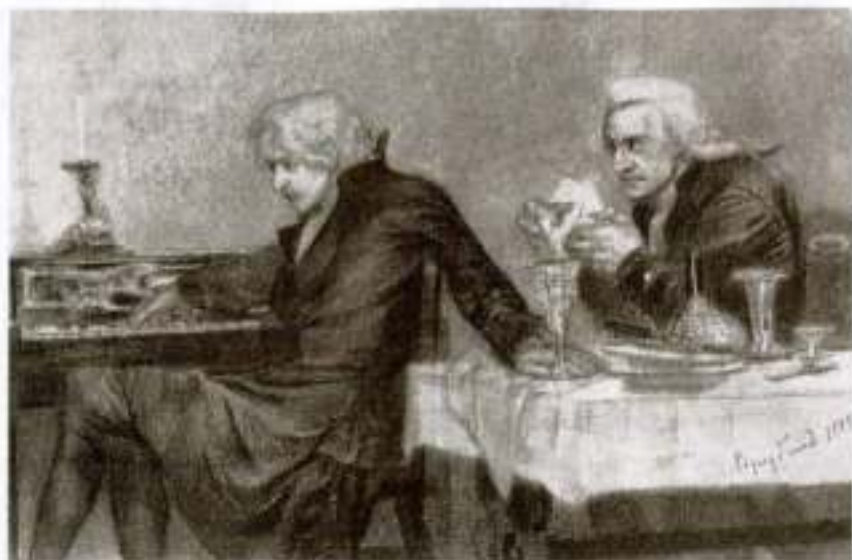
«Моцарт и Сальери». Художник М. Врубель