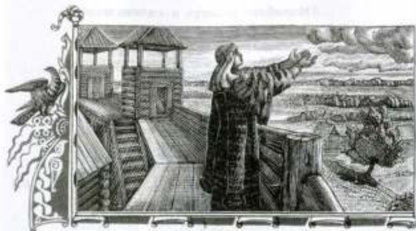
«Слово о полку Игореве». Плач Ярославны. Художник В. Фаворский