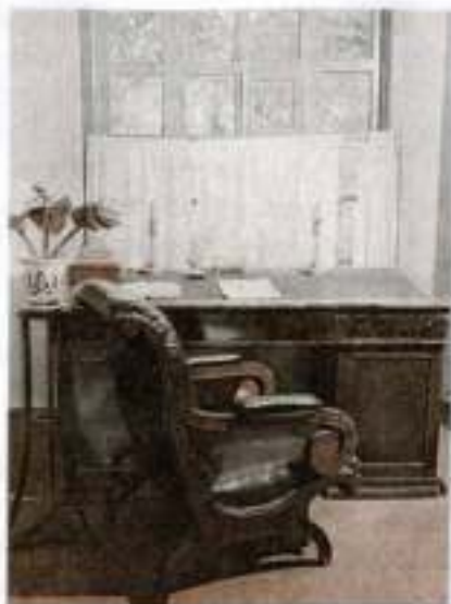
Кабинет М. Ю. Лермонтова в мемориальном музее в Пятигорске. Фотография

«водяное общество» Пятигорска. Попала на страницы повести и «золота арфа», беседка, внутри которой в деревянном футляре были установлены две арфы, начинавшие звучать при порыве ветра. От беседки открывалась живописная панорама города и окрестностей, поэтому это место было избрано отдыхающими для прогулок между процедурами. По утрам отдыхающие собирались перед существующей до наших дней галереей пить лечебную воду. Лермонтов упоминает реально существовавший магазин Челахова и другие приметы хорошо знакомого ему города. Видимо, тогда же поэт начал работу над живописным полотном «Вид Пятигорска».