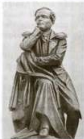
Памятник М. Ю. Лермонтову в Пятигорске. Скульптор А. М. Опекушин