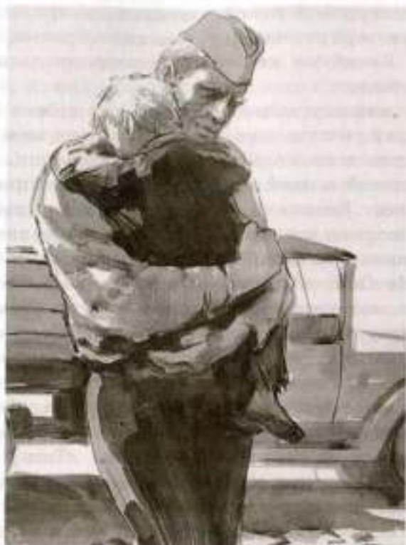
«Судьба человека». Художники Кукрыники

и спросил, как выдохнул: «Кто?» Я ему и говорю так же тихо: «Я — твой отец».