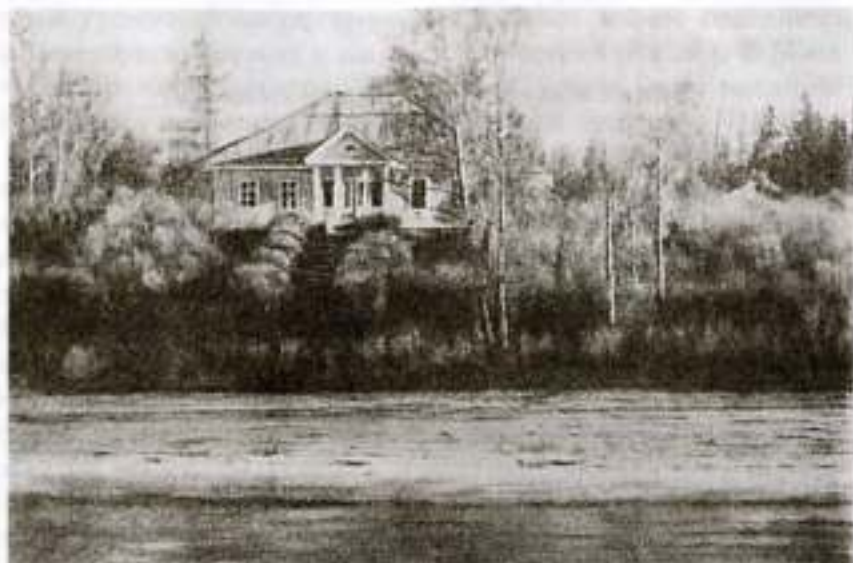
Михайловское. Дом-музей А. С. Пушкина. Фотография