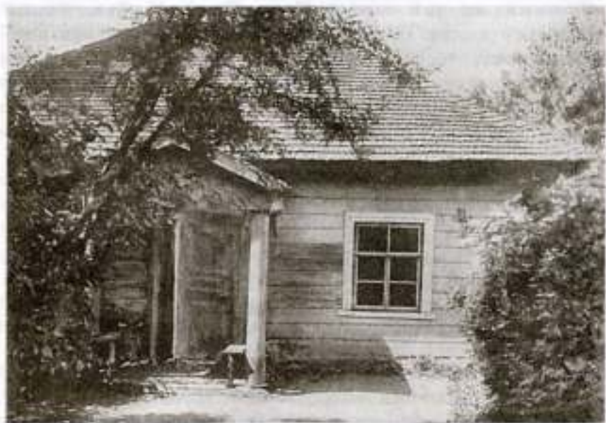
Михайловское. Домик плли. Фотография