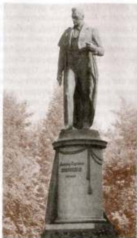
Памятник А. С. Грибоедову в Москве. Скульптор А. А. Мануйлов