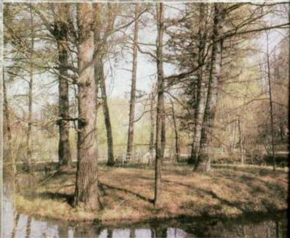
Михайловское. «Остров уединения»

Мне ни к чему одические рати И прелесть элегических затей. По мне, в стихах всё быть должно некстати, Не так, как у людей.