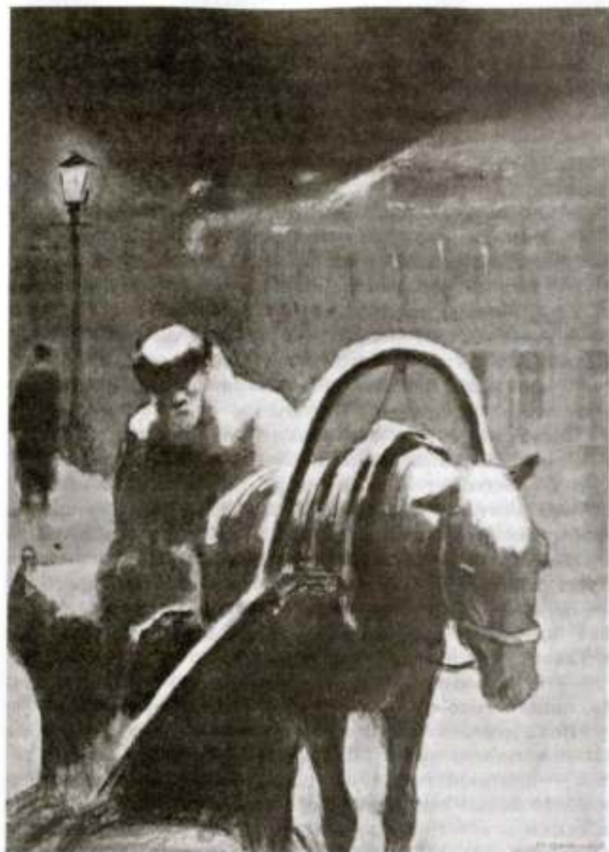
«Тоска». Художники: Кукрыники