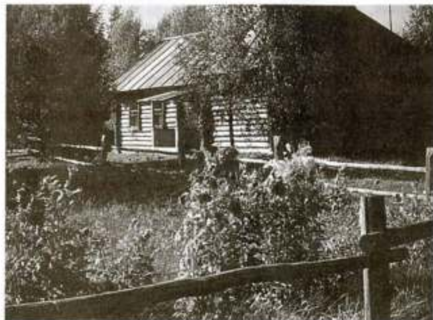
Дом Твардовских в Загорье. Фотография

торый был куплен отцом поэта Трифоном Гордеевичем через Земельный банк с выплатой в рассрочку. Этот клочок земли теперь известен как «поэтическое Загорье» — малая родина поэта, «начало всех начал».