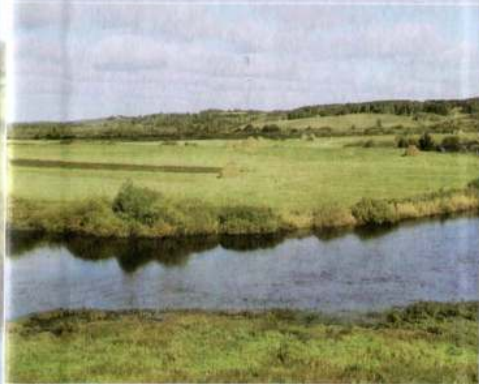
Вид с Тригорского холма