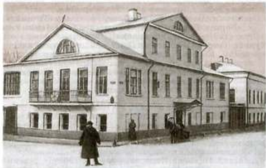
Дом Грибоедовых на Новинском бульваре в Москве. Фотография. Конец XIX в.