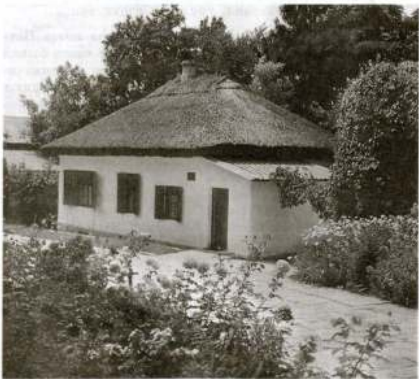
Мемориальный музей «Домик Лермонтова» в Пятигорске. Фотография

Пятигорские впечатления легли в основу повести «Княжна Мери», где описаны многие достопримечательные места города и окрестностей. На страницах повести мы встречаем упоминание о гроте Дианы, на площадке перед которым по вечерам собиралось