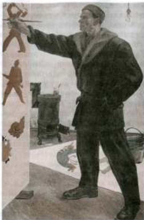
В. Маяковский в РОСТА.