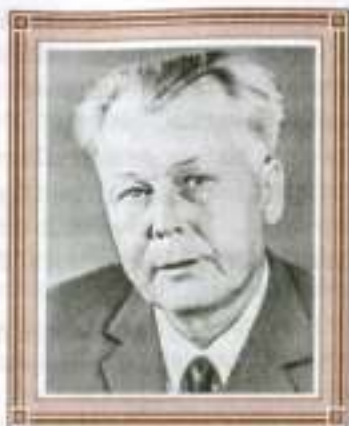
Александр Трифонович ТВАРДОВСКИЙ (1910—1971)